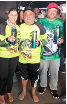
4º Lugar Equipe Chumbo Quente da Tupy