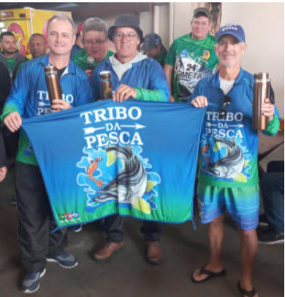
3º Lugar Equipe Tribo da Pesca da Tupy