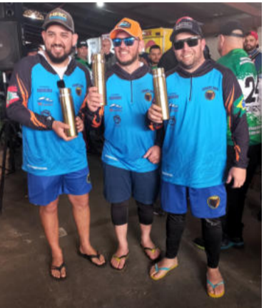
1º Lugar Equipe HRC da Ferramentaria Ribeiro

As direções do STIMEJ e SINTRAMSF agradecem a cada uma e cada um que esteve presente e parabeniza as equipes vencedoras. Ser um sindicato cidadão via além da luta por melhores condições de trabalho e de vida, é estar presente na vida das sindicalizadas e dos sindicalizados, promovendo momentos de luta, de formação, de aprendizado, mas também de lazer e diversão!