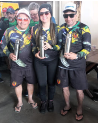
2º Lugar Equipe Boia Funda da Empresa Grampel